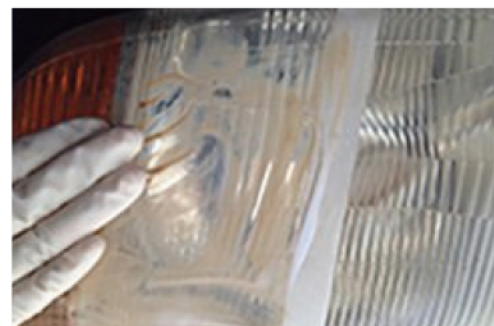
ベースクリナーで表面の汚れを浮かせて落とす