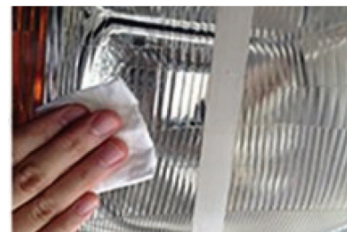
ガラスプロテクトで光沢復活! 細かなキズを埋込、強靱なガラス被膜で強力ガード